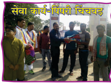
सेवा कार्य-पिंपरी चिंचवड