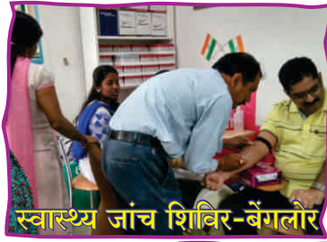
स्वास्थ्य जांच शिविर-बैंगलोर