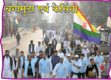
बंगोमुंडा एवं कैसिंगा