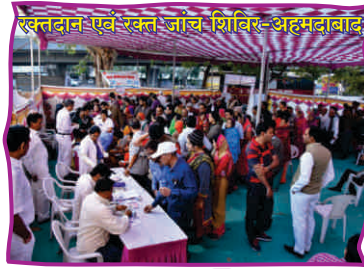
रक्तदान एवं रक्त जांच शिविर-अहमदाबाद