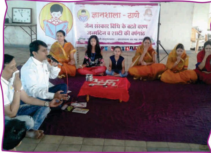
सामूहिक जन्मदिवस एवं वैवाहिक वर्षगांठ-ठाणे