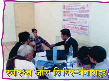
स्वास्थ्य जांच शिविर-गंगाशहर