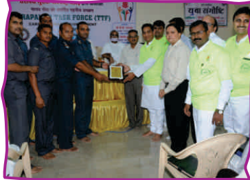
तमिलनाडु एवं केरल स्तरीय टास्क फोर्स ट्रेनिंग बैरम्प-चेन्नई