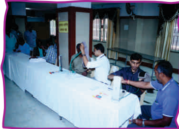
28वां राष्ट्रीय यातायात जागरूकता अभियान कार्यक्रम-मैसूर