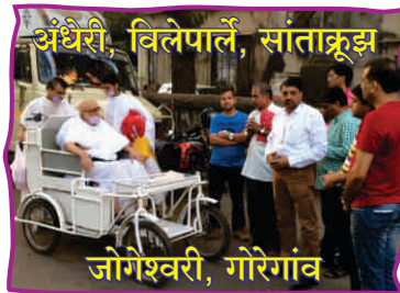
अंधेरी, विलेपार्ले, सांताक्रूझ जोगेश्वरी, गोरेगांव