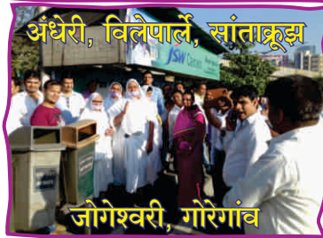
अंधेरी, विलेपार्ले, सांताक्रूझ