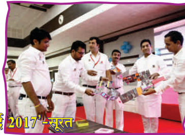
गुजरात स्तरीय ब्यक्तित्व विकास कार्यशाला 'सोहार्द 2017'-सूरत