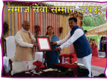
समाज सेवा सम्मान-जयपुर