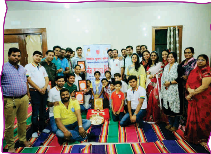
सामूहिक जन्मदिवस-विजयनगर, बेंगलोर