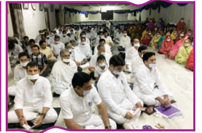
दक्षिणांचल युवा सम्मेलन 'आह्वान'-बेंगलोर