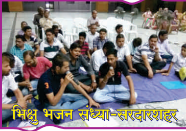
भिक्षु भजन संध्या-सरदारशाहर