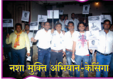
नशा मुक्ति अभियान-केसिंगा