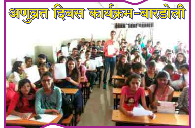
अणुव्रत दिवस कार्यक्रम-बारडौली