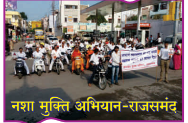
नशा मुक्ति अभियान-राजसमंद