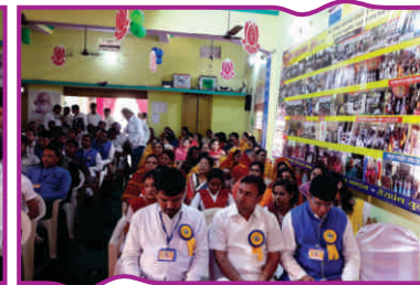
पश्चिम ओडिशा प्रांतीय स्तरीय व्यक्तित्व विकास कार्यशाला 'उड़ान'-तुषरा