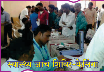
स्वास्थ्य जांच शिविर-केसिंगा