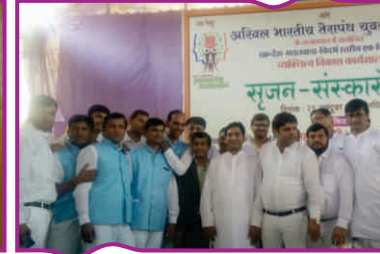
खांदेश मराठवाड़ा विदर्भ स्तरीय व्यक्तित्व विकास कार्यशाला 'सृजन-संस्कारों का'-शहादा