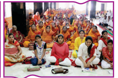
पूर्वी ओडिशा स्तरीय व्यक्तित्व विकास कार्यशाला 'कौशल-हुर है तो कदर है'-कटक