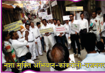
नशा मुक्ति अभियान-कांकोरोली-राजनगर