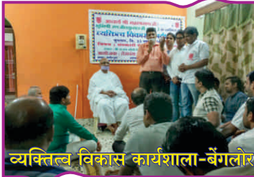
व्यक्तित्व विकास कार्यशाला-बेंगलूर