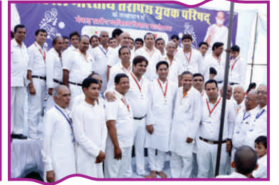
मेवाड़ स्तरीय व्यक्तित्व विकास कार्यशाला 'संवर्धन'-करेड़ा