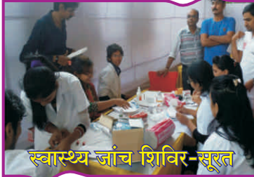
स्वास्थ्य जांच शिविर-सूरत