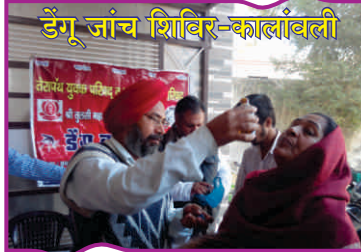
डेंगू जांच शिविर-कालांबली