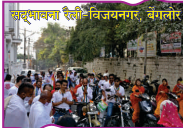
सद्भावना रैली-विजयनगर, बेंगलूर