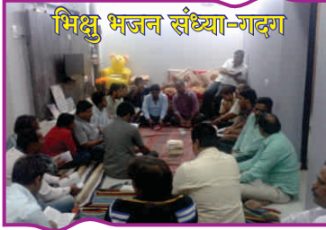
भिक्षु भजन संध्या-गदग