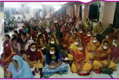
समय प्रबंधन कार्यशाला-धुलिया