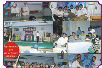
अहमदाबाद - प्रतियोगिता