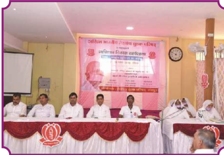
व्यक्तित्व विकास कार्यशाला - रायपुर