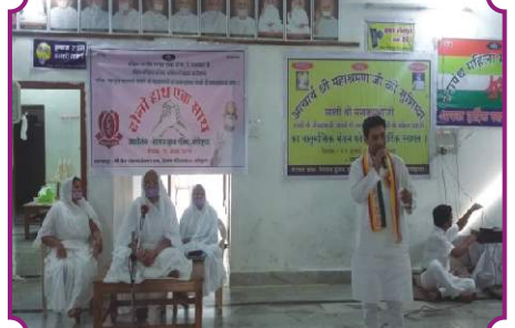
व्यक्तित्व विकास कार्यशाला - बंगोमुण्डा