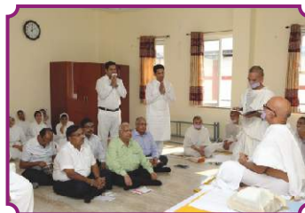
राष्ट्रीय अध्यक्ष एवं महामंत्री श्रीचरणों में

नूतन चिन्तन - नया विकास, युवकों में जागे विश्वास