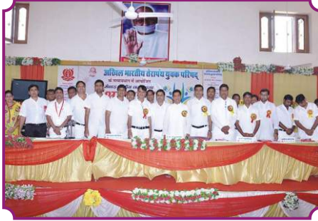
व्यक्तित्व विकास कार्यशाला - भीलवाड़ा