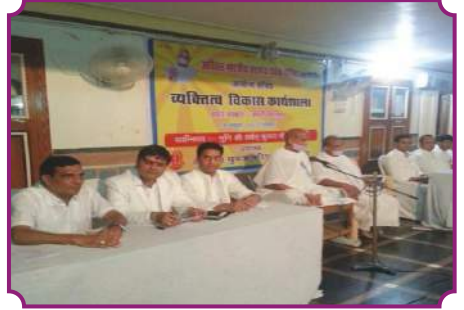
व्यक्तित्व विकास कार्यशाला - आसीन्द