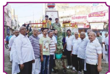
सिरसा - वृक्षारोपण