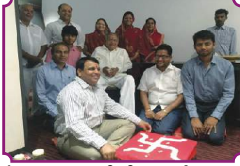
जैन संस्कार विधि, फरीदाबाद