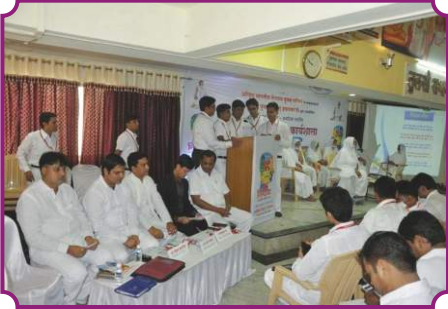
व्यक्तित्व विकास कार्यशाला - इचलकरंजी