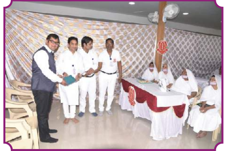
व्यक्तित्व विकास कार्यशाला - रायपुर