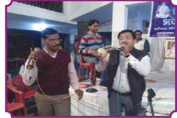
भिक्षु भजन संध्या, सिरसा