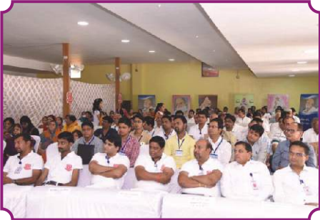
व्यक्तित्व विकास कार्यशाला - रायपुर