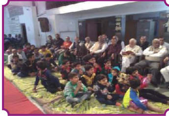
भिक्षु भजन संध्या, सिरसा