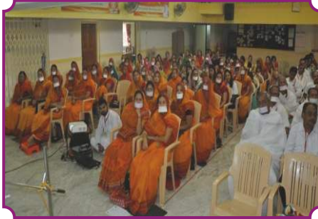
व्यक्तित्व विकास कार्यशाला - इचलकरंजी