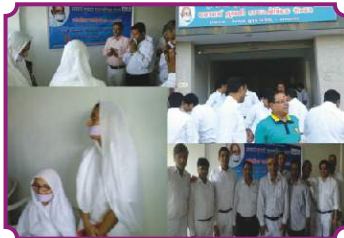
अहमदाबाद - ए.टी.डी.सी.