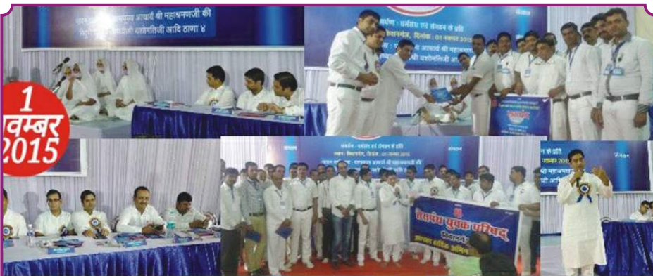
कवि सम्मेलन - कांटाबाजी