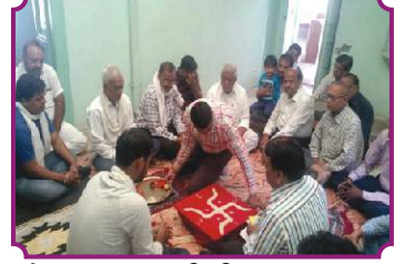
जैन संस्कार विधि, गंगाशहर