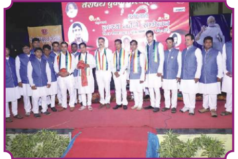
कवि सम्मेलन - कांटाबाजी