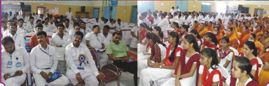
व्यक्तित्व विकास कार्यशाला - किशनगंज