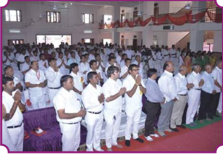
व्यक्तित्व विकास कार्यशाला - भीलवाड़ा