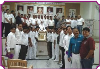
बैंगलोर - अभिनन्दन समारोह