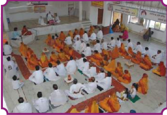
भक्तामर स्तोत्र अनुष्ठान, पुर