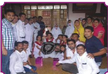
चेन्नई - प्रतियोगिता