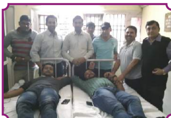
सिरसा - रक्तदान शिविर