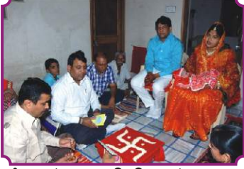
जैन संस्कार विधि, गंगाशहर